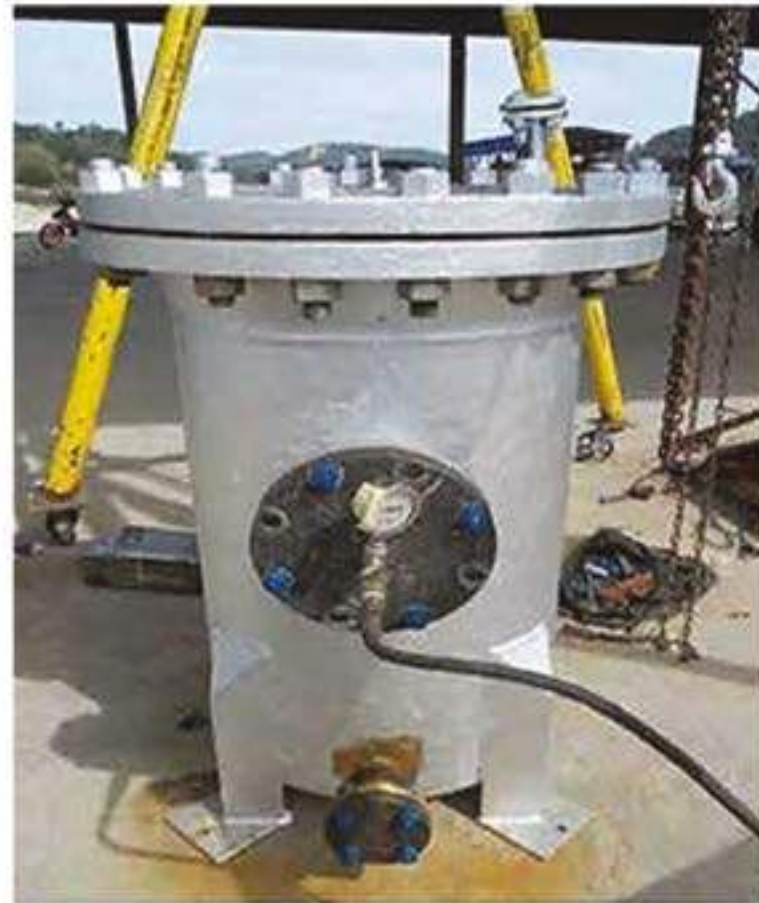
A REPAIR OF STRAINER HOUSING STR-1201 FOR VCMSB