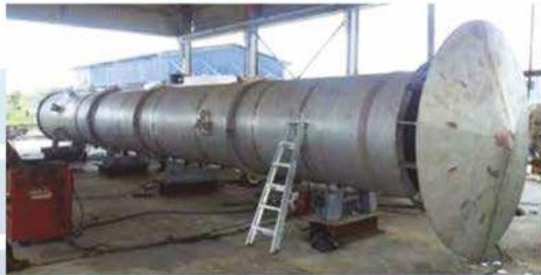
B FABRICATION OF CTG & GTC EXHAUST DUCT FOR FPSO CHENDOR TOPSIDE.