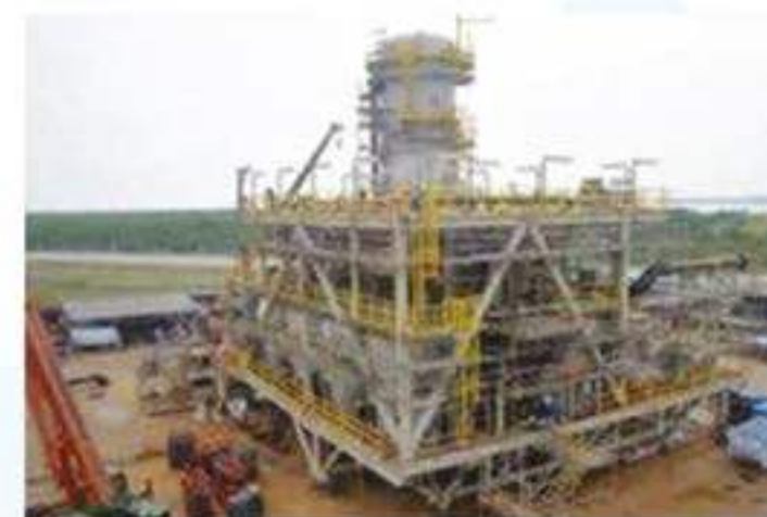
04 FABRICATION AND INSTALLATION OF STEEL STRUCTURE, PIPING AND EQUIPMENT FOR JUBILEE