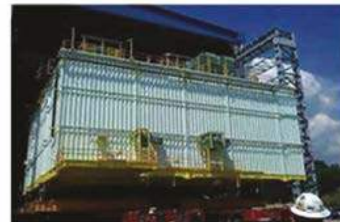
02 GUMUSUT KAKAP: FABRICATION OF PERMANENT LIVING QUARTERS, PIPE SUPPORT, GRILLAGE