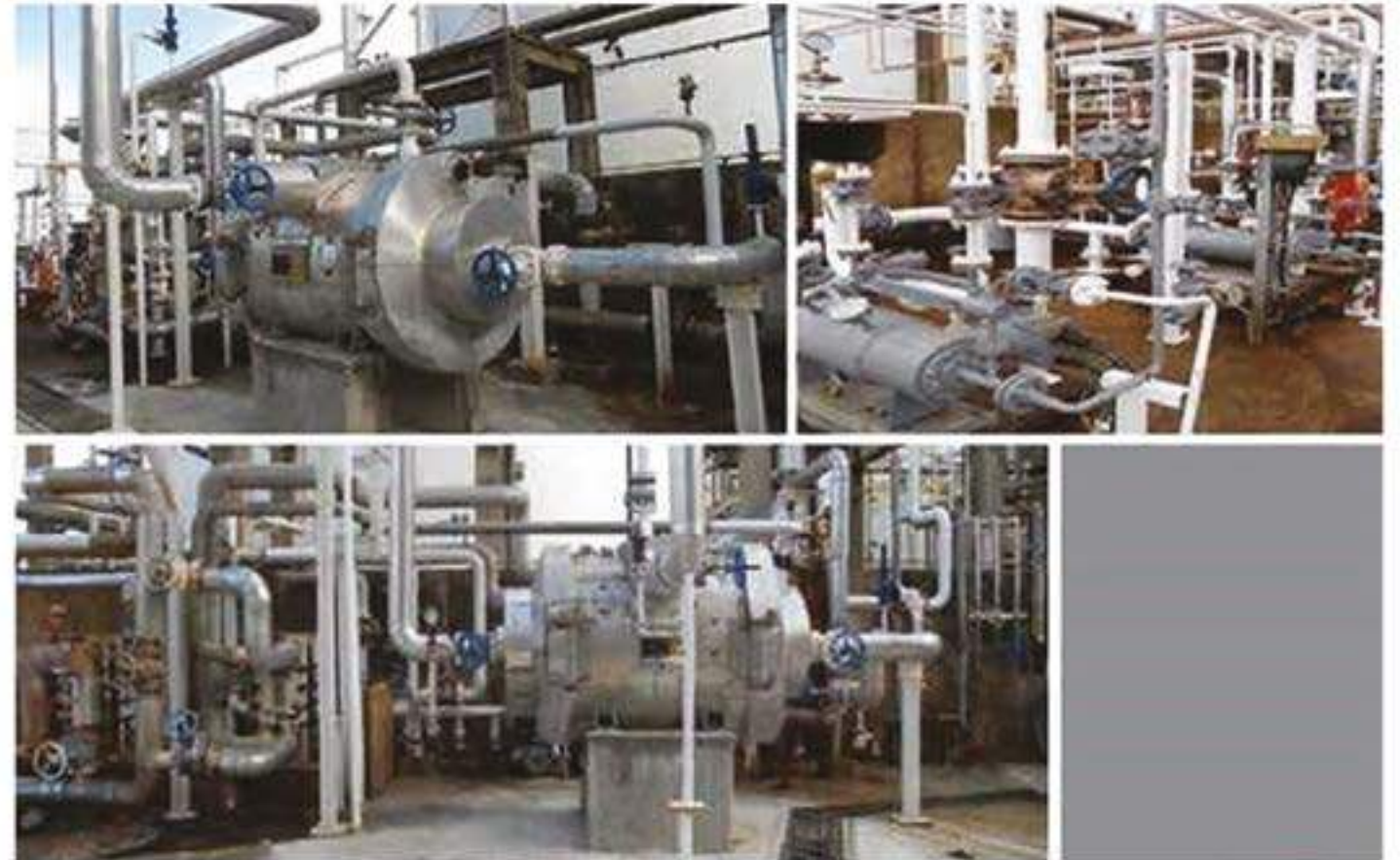
D PROVISION OF SERVICE FOR MECHANICAL PACKAGE WORK RESIN CHANGE OUT AND