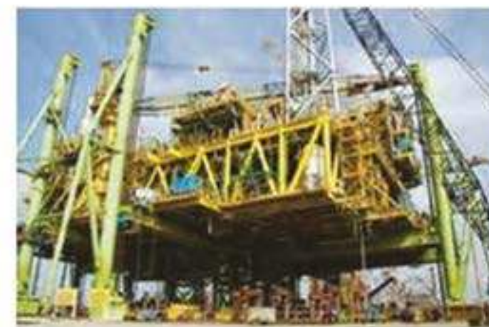
03 GURNUSUT KAKAP : SUPER-LIFT ACTIVITY ASSISTANT