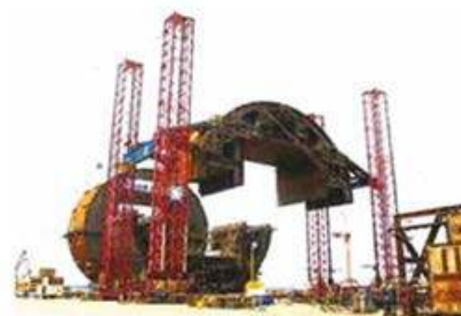
01 SUPPLY AND OPERATE 3200 TONS PUSH UP